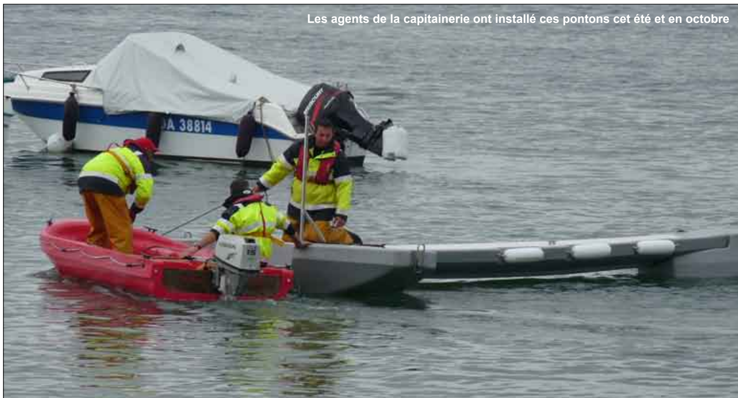
Les agents de la capitainerie ont installé ces pontons cet été et en octobre

Le développement économique passe aussi par l'amélioration du port de plaisance.