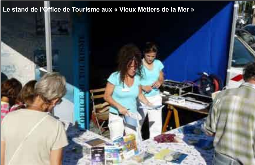
Le stand de l'Office de Tourisme aux « Vieux Métiers de la Mer »

d'hébergements. Heureusement, avec le niveau d'ensoleillement élevé du mois d'août, notre presqu'île a connu un taux de fréquentation exceptionnel comme dans l'ensemble des communes littorales. Toutefois, les principales tendances des années précédentes, vacances plus courtes, réservations de dernière minute ou dépenses moins importantes, se sont accentuées. Ce phénomène semble découler de l'incertitude de la météo depuis déjà deux saisons et de l'ambiance morose liée à une certaine baisse du pouvoir d'achat.