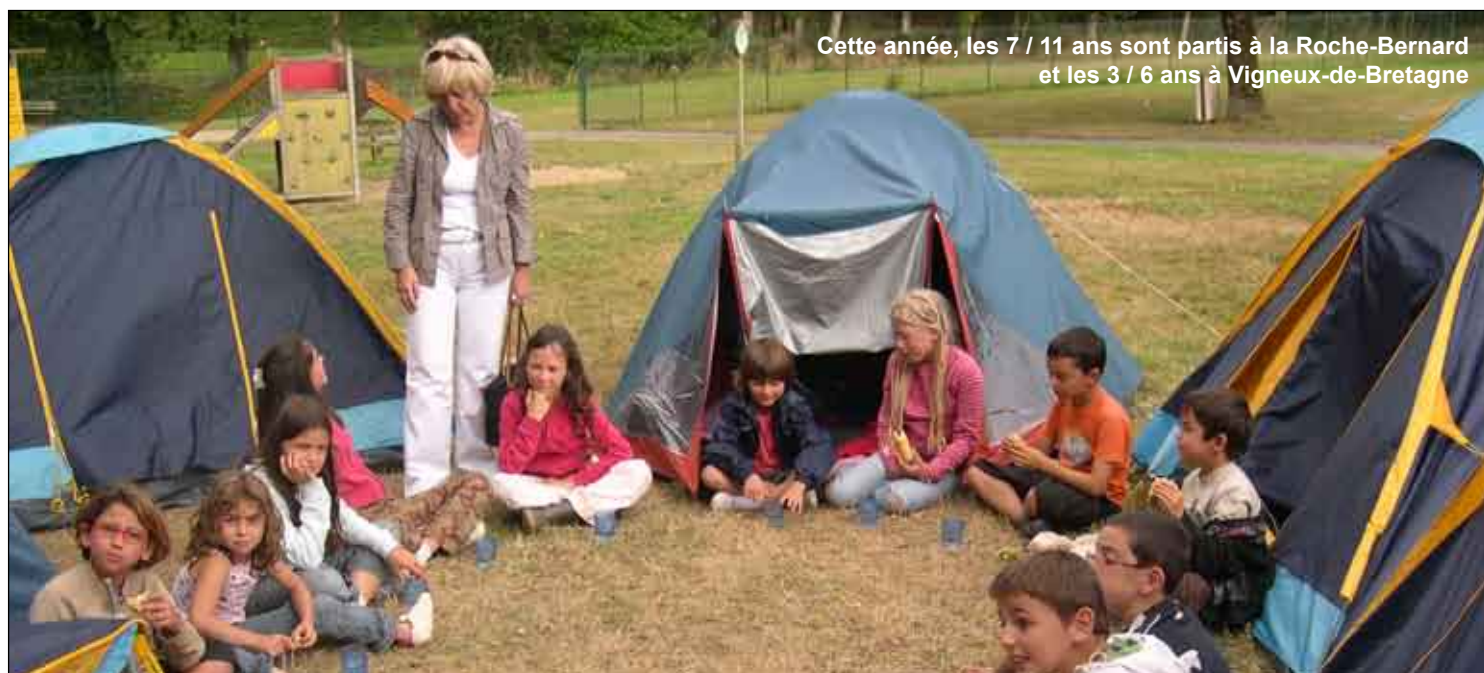
Cette année, les 7 / 11 ans sont partis à la Roche-Bernard et les 3 / 6 ans à Vigneux-de-Bretagne

Le service des sports organise des cours de natation (apprentissage et perfectionnement) pour les 6-10 ans le mercredi matin de 9h00 à 11h00, à la piscine de Guérande. Cette année une trentaine d'enfants sont inscrits, la municipalité a décidé d'offrir à chaque enfant une paire de lunettes de natation.