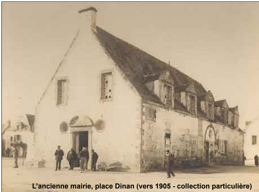
L'ancienne mairie, place Dinan (vers 1905)

L'oligarchie où se débat la Communauté du Croisic est enrayée par le Parlement de Bretagne en 1716. Cette décision rétablit la séparation entre pouvoir temporel et spirituel et renouvelle la composition de l'assemblée. En 1787, un édit instaure des municipalités partiellement élues, dotées de quelques attributions, notamment fiscales. Cependant, au Croisic comme ailleurs, les réformateurs attendent beaucoup de la réunion des États Généraux en 1789. Ce ne sera bientôt plus de réformes dont il sera question, mais de révolution! Mais c'est une autre histoire... ■